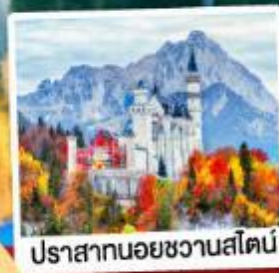
ปราสาทน้อยชวานส์ไตน์