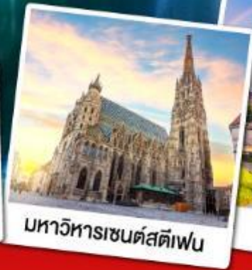
มหาวิหารเซนต์สตีเฟ่น