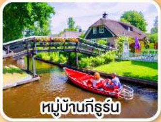
หมู่บ้านทึร์รัม