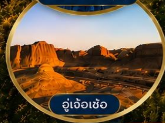
อู่เจ้อเซ่อ