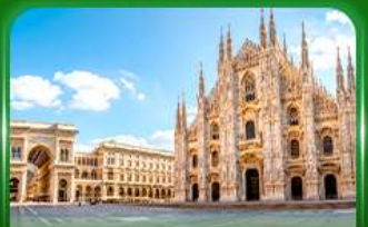
มหาวิหารดูโอโมแห่งมิลาน