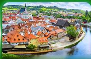
เมืองมรดกโลก เซสท์เคิร์มลูฟ