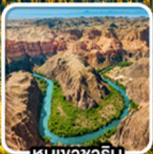
หุบเขาซาริน