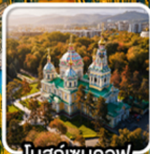
โบสถ์เซนคอฟ

นั่งกระเช้าคอนโดล่าขึ้นสู่ชิมบูลัก สทึร์สออร์ก ไข่มุกแห่งเทือกเขาเทียนชาน ทะเลสาบโคลโซ หุบเขาเจดี โอกูซ / ภูเขาหินเทพนิยาย / ทะเลสาบอัสซิกกุล ชมการแสดงการล่าเหยื่อของนกอินทรี