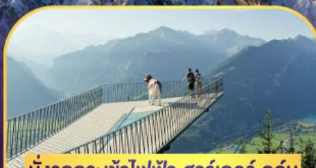
นั่งรถกระเช้าไฟฟ้า ฮาร์เตอร์ คูล์ม