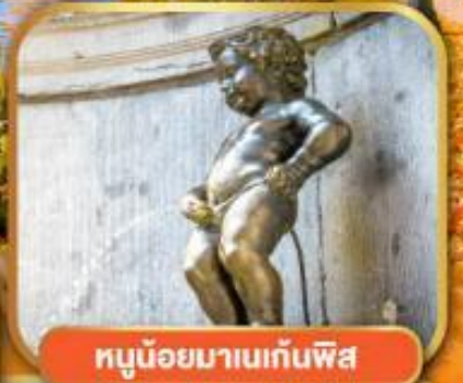
หุมน้อยมาเนกันพิส