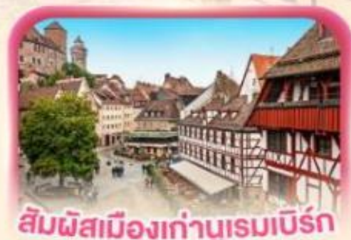
สิมพิสเมืองเก่าบูเรมเบิร์ก