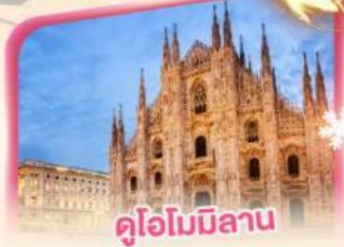
คูโอโมมิลาน