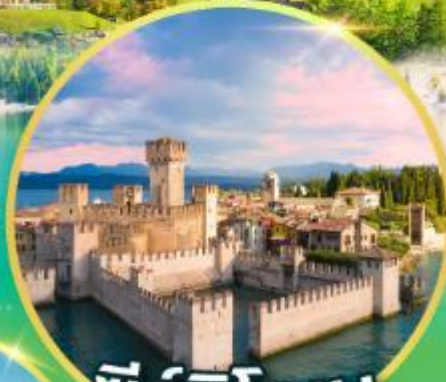
ซิร์มิโอเน