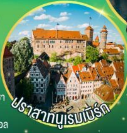
ปราสาทบูเรมเบิร์ก