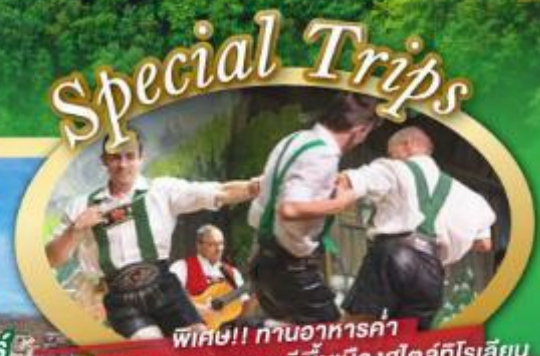
พิเศษ!! กำหนดอาหารค่ำ พร้อมชมการแสดงดนตรีพื้นเมืองสไตล์โรเธีย และเยือนเมืองอูเทรคต์ สีสันใหม่เนเธอร์แลนด์