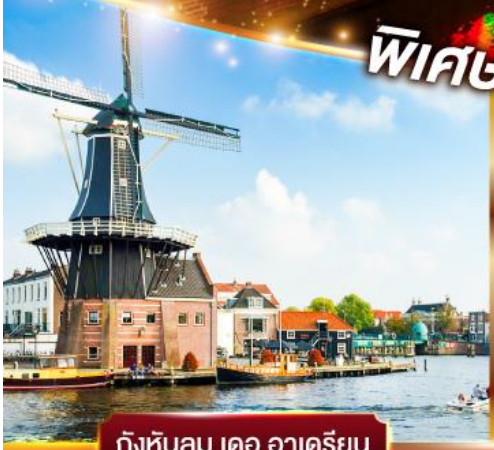
กังหันลม เดอ อาเดรียน