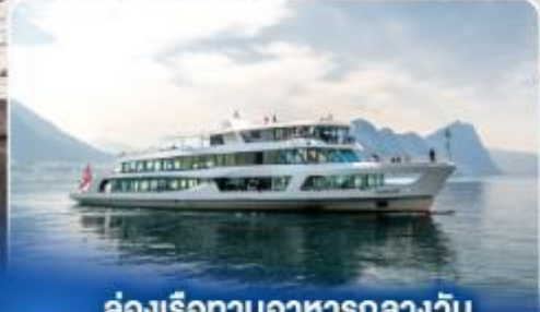
ล่องเรือทานอาหารกลางวัน ทะเลสาบลูซิิร์น