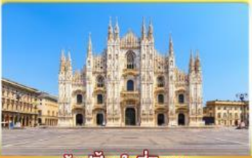
ช้อปปิ้งจุใจที่มิลาน