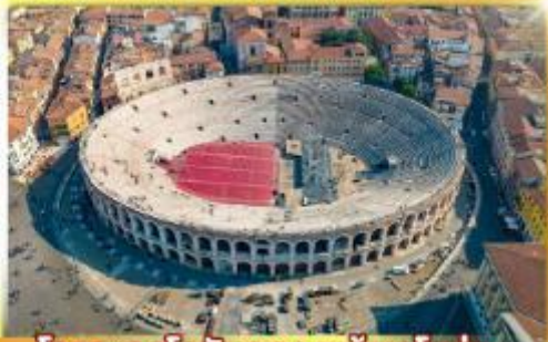
โรงละครโรมันกลางจัหวโรม่า