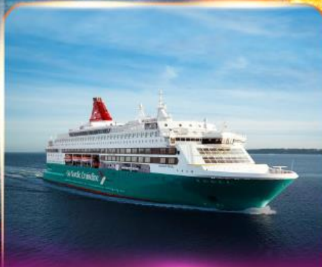
เรือสำราญ GO NORDIC CRUISE LINE