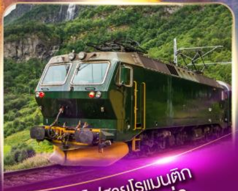
รถไฟสายโรเมนติก ฟลินส์บาน่า