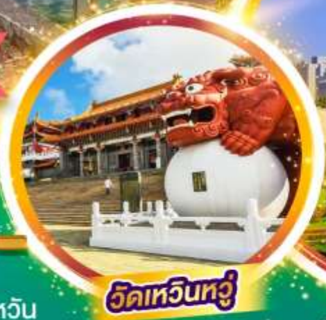
วัดหัวหนิว