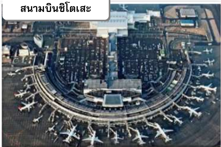
สนามบินชิตเสะ