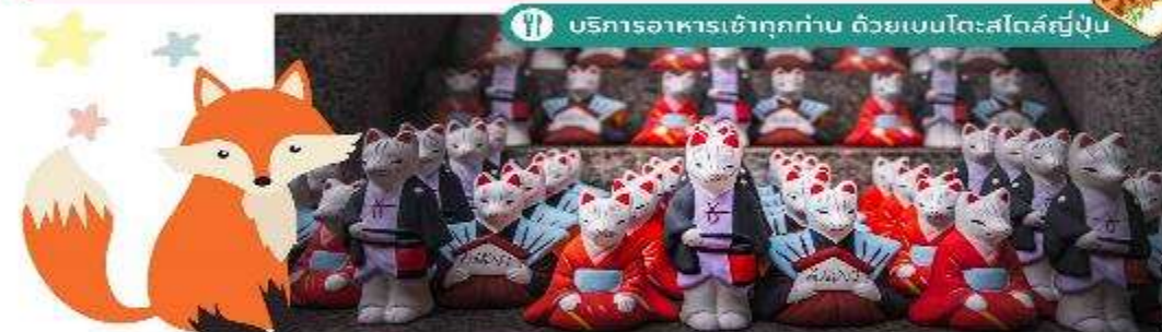
บริการอาหารเข้าทุกท่าน ด้วยเบนโตะสไตล์ญี่ปุ่น

นำท่านเดินทางสู่ ศาลเจ้าเทพเจ้าจักรวาลฟูชิมิอินาริ หรือที่คนไทย ชอบเรียกกันว่าศาลเจ้าแดง เป็นศาลเจ้าชินโต มีชื่อเสียงโด่งดังจาก ประตูโทริอิ (Torii Gate) หรือ เสาสีแดง ที่เรียงตัวกันจำนวนหลายหมื่นต้นจนเป็นทางเดินได้ทั่วทั้งภูเขาอินาริ ที่ผู้คนเชื่อกันว่าเป็นภูเขาศักดิ์สิทธิ์ โดยเทพอินาริจะเป็นตัวแทนของความอุดมสมบูรณ์ การเก็บเกี่ยวข้าว รวมไปถึงพืชผลไร่ต่างๆ และมีจะมีจักรวาลเป็นสัตว์คู่กายจึงสามารถพบเห็นรูปปั้นจักรวาลมากมายด้วยเช่นกัน