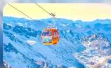
ต้ากู่ปิงชว่น